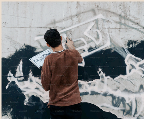
Illustration et street art