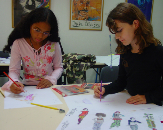
Mode et stylisme