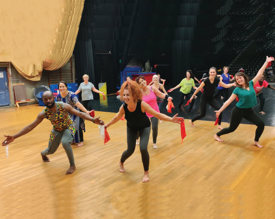
Danse africaine traditionnelle