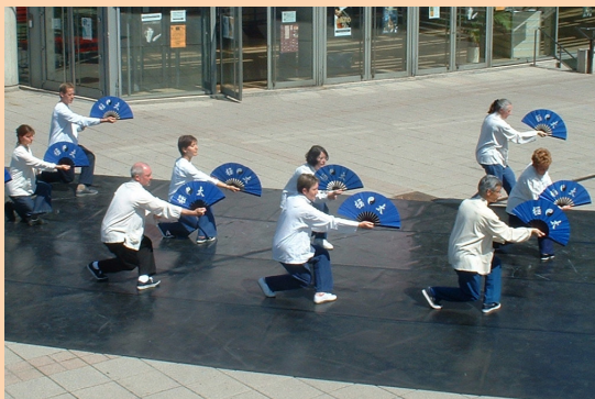
Tai chi chuan